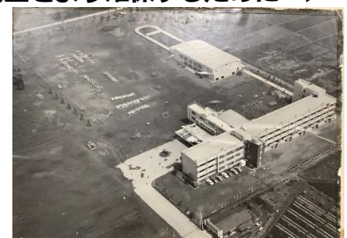
《開校間もない志木二小》

1月から児童と自動車の動線を分離するための工事が始まります。現状では、児童の登校の時間に教職員の出勤の時間が重なってしまったり、下校時に業者さんの運搬等が重なったりしてしまうことがあります。まずは、給食のための業者さんやごみを収集してくださる業者さんが、学校東側から侵入できるよう工事を始めます。開校当初から地域の方々には、豊かな自然環境を整えていただくために、植樹や樹木の手入れをずっとしていただいていると聞いております。今回の工事では、児童の安全をより確実にするために、苦渋ではありますがご協力をいただいた樹木を一部伐採しなくてはならない場合がありますことをご了承いただけると幸いです。