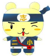
志木二小キャラクター しきにん